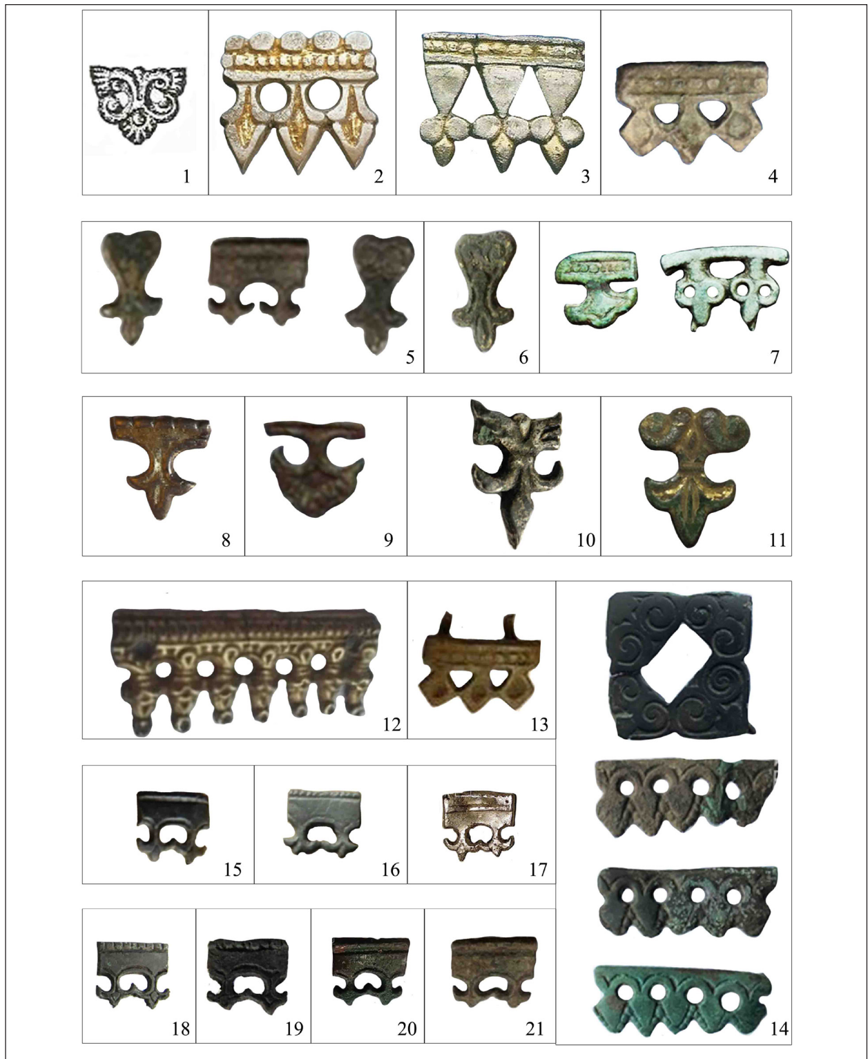
2. kép. 1: Veret Tiszaeszlár-Bashalomról (DIENES 1986, 102/ 22. kép alapján); 2: Veret Eperjeskéről (FODOR 1996, 74/ Fig. 6. alapján); 3: A szolyvai tarsolylemez széle (FODOR 1996, 178/ Fig. 1. alapján); 4–7, 10–13: Szórványleletek Ukrajna területéről; 8–9: Veretek Ukrajna területéről, Podolje; 14: Szórványleletek Ukrajna területéről, Szumi terület; 15–21: Szórványleletek Ukrajna és Oroszország területéről

Рис. 2. 1: Накладка, Тисзаеслар-Баишало (по DIENES 1986, 102/ 22. kép); 2: Накладка, Эперешке (по FODOR 1996, 74/ Fig. 6.); 3: Край пластины сумочки, Сольва (по FODOR 1996, 178/ Fig. 1.); 4–7, 10–13: Случайные находки, Украина; 8–9: Накладки из Украины, Подолье; 14: Случайные находки, Украина, Сумская область; 15–21: Случайные находки из Украины и России