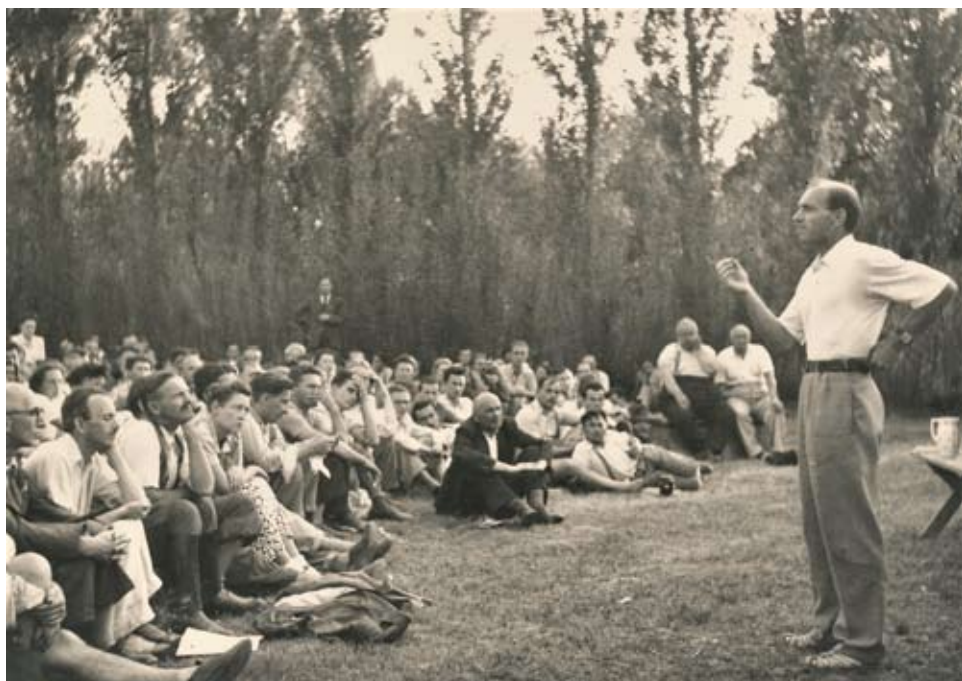
10. kép: László Gyula előadás közben a Szárszói konferencián. Szárszó, 1943. augusztus 26.

„Soha nem gondoltam volna, hogy a sírok elhelyezéséből és tartalmából olyan szépen rekonstruálható a honfoglaló magyarság politikai és társadalmi berendezkedése, mindennapos élete, anyagi és szellemi kultúrája. László Gyula előadását nagy élvezettel hallgattuk: azt hiszem, lélekben akkor egyek voltunk.” 67 László Gyula a Szárszói találkozón 50. évfordulóján így vallott előadásáról: „Miről beszélt? Nagyjából arról, amit később »A honfoglaló magyar nép élete« című könyvemben megírtam. (...) Vajon miért fogadták ezt olyan megható melegséggel, miért tapadtak erre rá akkor az egyébként a politikai küzdelem útvesztőibe belevesző barátaink? A kisebbség-érzésük alól jelentett szinte boldog felszabadulást előadásom, amelynek hátterében ott élt Zrínyi Miklós tanítása: egy nemzetnél sem vagyunk alábbvalók. Ebben láttam előadásom és életem értelmét.” 68