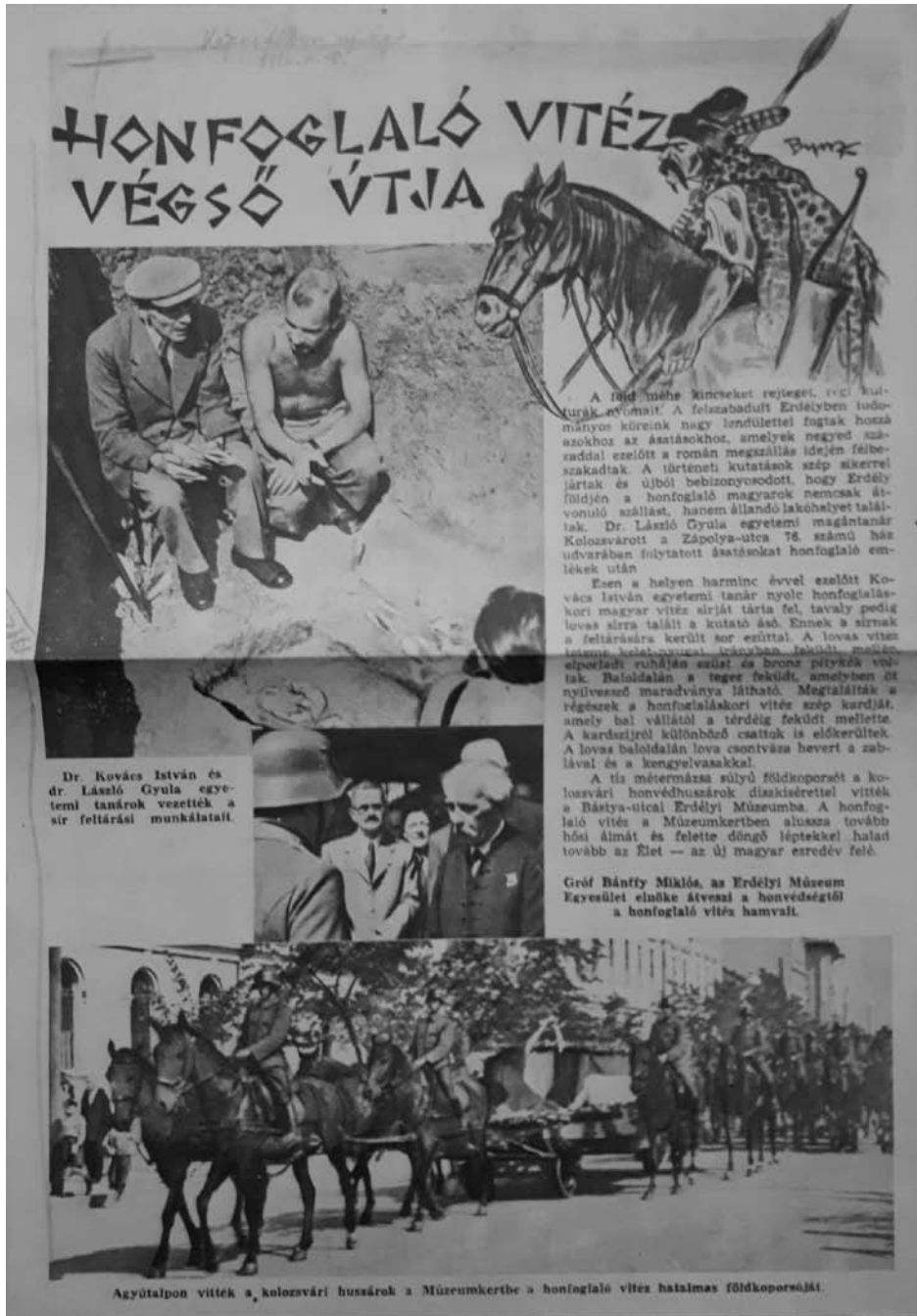
8b. kép: Egy korabeli újságcikk az ásásokról, valamint az ünnepségről, Képes Tábori Újság, Kolozsvár, 1942.