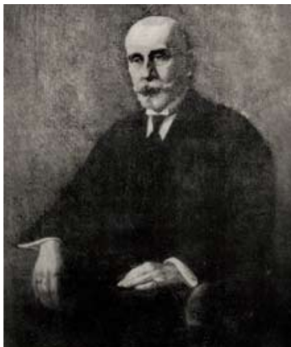
5. kép: Pósta Béla (1866–1919), a kolozsvári régészeti iskola megalapítója

Lendületes munkájának, az erdélyi magyar régészet kiteljesedésének az első világháború, majd a trianoni döntés vetett véget. A román tudománypolitika irányítása alá került erdélyi régészettudomány két évtizedig szinte kizárólag az őskori és ókori – főként a dák és római – emlékek kutatására koncentrált. 24 A magyar emléktárhely és a vele rokon népvándorlás kori kultúrák felszínre hozatala és tanulmányozása csak Észak-Erdély visszacsatolása után vált ismét lehetővé. A hazatelepülő Ferenc József Tudományegyetem régészeti tanszékének vezetőjévé 1940 őszén az erdélyi származású Roska Márton (1880–1961) (6. kép) nevezték ki.