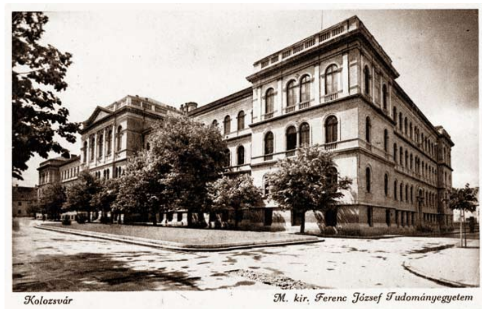
3. kép: A kolozsvári Ferenc József Tudományegyetem, 1940

1940. augusztus 30-án, a második bécsi döntést követően Észak-Erdély és Székelyföld nagyobb részének visszacsatolása után a magyar közigazgatás helyreállításával egyidőben megindult a tudományos élet újjászervezése is. Az erdélyi tudománypolitika három nagy intézményre, az Erdélyi Múzeum Egyesületre (EME), a Szegedről visszatelepülő Ferenc József Tudományegyetemre (3. kép) és az újonnan létesített Erdélyi Tudományos Intézetre (ETI) számíthatott. A magyar kormány tudománypolitikájának elsődleges célja az erdélyi magyarság identitásának megerősítése volt, és ennek egyik fontos alapköve a történettudomány és a népvándorláskori régészet lett. Az új célnak megfelelően az egyetemet is át kívánták szervezni. A kolozsvári értelmiségiek egyik jelentős csoportja szerint az új feladatok teljesítésének alapfeltétele a személyi változások véghezvitele volt: