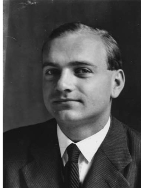
1. kép: László Gyula 1940-ben

Visszaemlékezéseiben László Gyula úgy fogalmazott kolozsvári éveiről, hogy számára Erdély valóban „Tündérorság” volt, mert „ott békült ki önmagával és a sorssal”. A kincses városban eltöltött időszak tudományos munkásságában is a legfontosabb korszaknak tartható, hiszen a későbbiek során részletesebben is kidolgozott téziseit, régészeti módszertani újításait itt fogalmazta meg először, és bár tovább finomított rajtuk, élete végéig kitarzott mellettük.