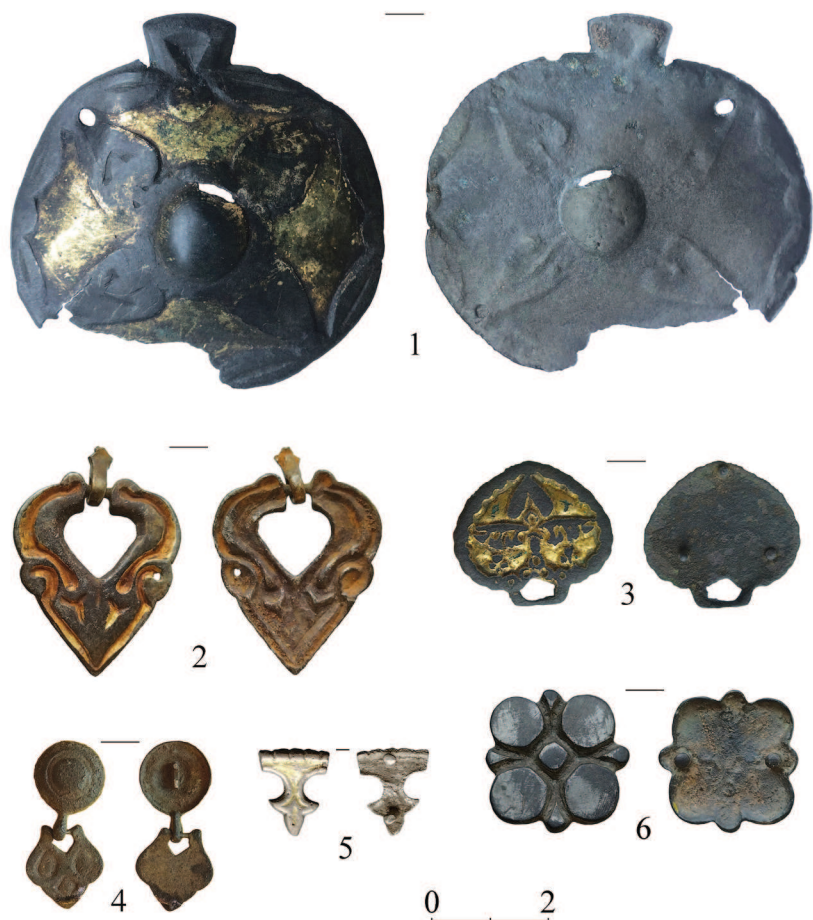
Рис. 1. Випадкові знахідки речей «угорського кола» з території України.

стане доказом того, що цей тип нашивок виник ще до заселення Карпатського басейну. До того часу питання про те, чи можуть східноєвропейські нашивки у формі розетки бути експортними знахідками X ст. з Карпатського басейну, не може бути вирішене.