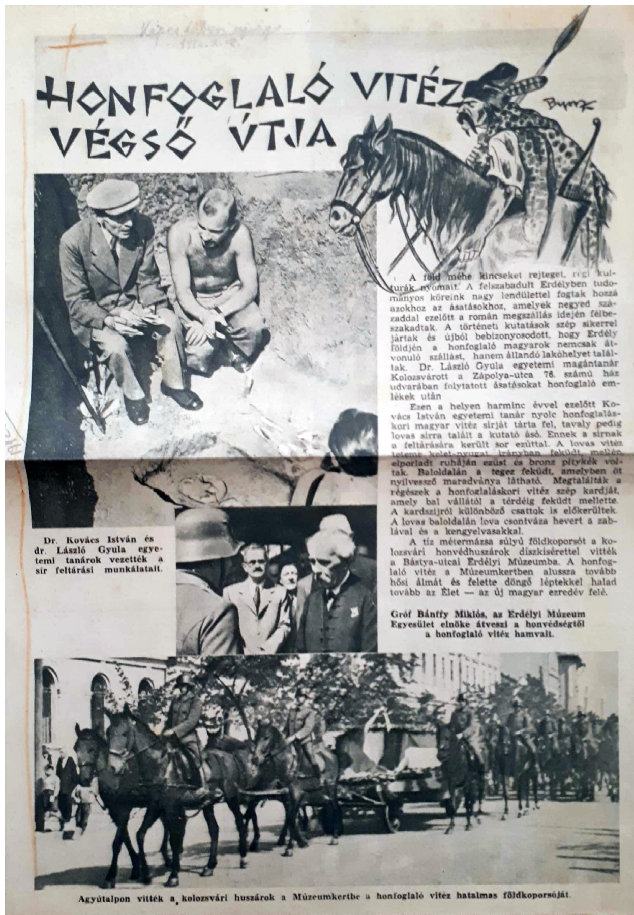
5. kép. Korabeli újságcikk a László Gyula által vezetett Kolozsvár-Zápolya utcai feltárásokról Fig. 5. Newspaper article about Gyula László's excavations at Cluj/Kolozsvár, Zápolya street