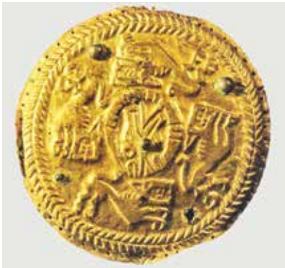
Állatalakkal díszített falera a beszláni temetőből, 2–4. század

Nem csak leleteket lehetett megtekinteni, lévén a múlt nem minden jelentős emléke szállítható múzeumba. Több épülettel és tárggyal, melyek nem fizikai valójukban kerültek kiállításra, interaktív, digitális formában, képernyőn keresztül, vagy éppen makettek formájában ismerkedhettek meg a látogatók, például a Nuzalban található, érett középkorban épült kápolnával és freskóival, vagy Rekom pogány szentélyével.