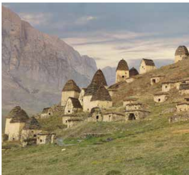
Dargavs, a „holtak városa”. 16. század végi – 19. század eleji kripták

Alánia kereszténysége tehát tavaly volt 1100 éves. A jeles alkalom nemcsak a kereszténység emlékeinek bemutatására adott remek lehetőséget a Kaukázus északi felén, hanem egy nagyszabású kiállítással és egyéb programokkal a teljes alán történelem és kultúra bemutatására is az Oroszországi Föderáció lakosai számára. A négy teremben felállított kiállítás az alánok anyagi kultúrájának teljes keresztmetszetét mutatta be a Krisztus születése körüli időktől az oszétok néprajzáig bezárólag. Az alkalom nekünk, jászoknak is külön érdekes. A Kárpát-medencébe költözött jászok ősei valószínűleg ebben az Alániában éltek, átélték ezeket az eseményeket, a kiállított tárgyak a középkorban az ő környezetükben voltak használatban, mielőtt a mongol hódítók hatására nyugat felé vándoroltak, hogy a mai Jászság területén találjanak maguknak új hazát.