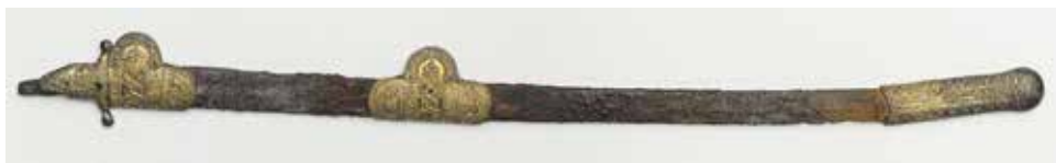
Szablya, Zmejszkaja sztanyica, 11. század vége – 12. század első fele (forrás: Чиждова, А. А.: Сокровища Аланского Царства. К 1100-летию крещения Алании. Санкт-Петербург 2022, 44)

Alánia kereszténysége tehát tavaly volt 1100 éves. A jeles alkalom nemcsak a kereszténység emlékeinek bemutatására adott remek lehetőséget a Kaukázus északi felén, hanem egy nagyszabású kiállítással és egyéb programokkal a teljes alán történelem és kultúra bemutatására is az Oroszországi Föderáció lakosai számára. A négy teremben felállított kiállítás az alánok anyagi kultúrájának teljes keresztmetszetét mutatta be a Krisztus születése körüli időktől az oszétok néprajzáig bezárólag. Az alkalom nekünk, jászoknak is külön érdekes. A Kárpát-medencébe költözött jászok ősei valószínűleg ebben az Alániában éltek, átélték ezeket az eseményeket, a kiállított tárgyak a középkorban az ő környezetükben voltak használatban, mielőtt a mongol hódítók hatására nyugat felé vándoroltak, hogy a mai Jászság területén találjanak maguknak új hazát.