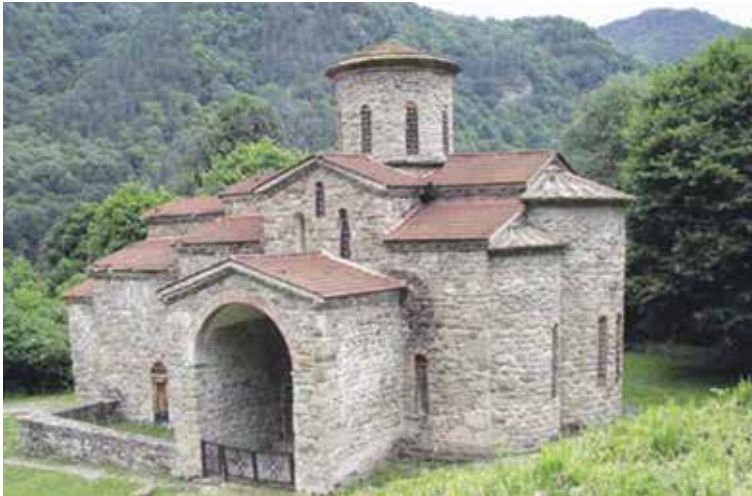
Templom a 10. század közepéről, Nyizsnyij Arhiz település mellől (forrás: Чижова, А. А. – Кадиева, А. А.: Аланские племена Северного Кавказа. In: Путешествие Ибн Фадлана: волжский путь от Багдада до Булгара. Каталог выставки. Москва 2016, 279)

Néprajzi Múzeum, az M. Sz. Tuganov Művészeti Múzeum, az Orosz Tudományos Akadémia Levéltára Szentpétervári Filiáléja, az Orosz Tudományos Akadémia Könyvtára és az Orosz Tudományos Akadémia Anyagi Kultúra-történeti Intézete mind adtak tárgyakat a kiállításba.