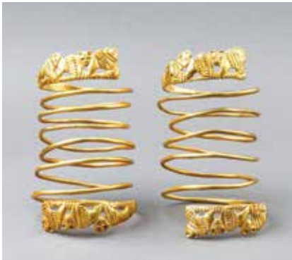
Állatalakos arany karperecek a Kr. e. 1. – Kr. u. 1. századból. Komarovo lelőhely