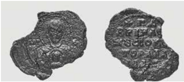
Gabriel ekszusziokratór (alán uralkodó) pecsétje, XI. század