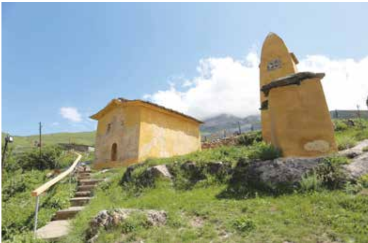
A faraskattai Illés templom a felújítás után