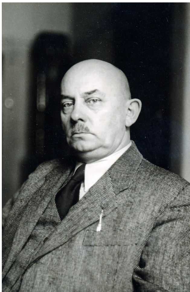
1. kép. Roska Márton (1880–1961) Fig. 1. Márton Roska (1880–1961)

egyetemen magántanárrá képesített, 1938-ban pedig a debreceni egyetemen ny. r. tanárrá neveztetett ki. Több régészeti szakműve jelent meg magyar, német és francia nyelven.” 4 Roska egykori mestere, Pósta Béla szellemiségében folytatta a megkezdett munkát: „[...] egykori tanítványa a Mester nyomdokain kíván és köteles haladni, mert ez vezet a célhoz, amelyet Ő tűzött ki: tanítványok nevelése, Erdély földjének a múlt emlékei felszínre hozatala érdekében való megvallatása, ezeknek az emlékeknek a közönség és a szakemberek részére való hozzáférhetővé tétele [...]” 5