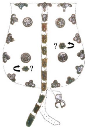
A kijevi peremveretes tarsoly szerkezeti rekonstrukciója

A harmadik tarsolylemezen (ltsz. ИМ/М-129) ismét a zárószíj futásához igazított díszítéssel találkozunk. A közepén futó szíj látványosan kikoptatta a lemez hossz tengelyét. Középen itt is megfigyelhető a szíjbújtató nyílása, de e lemeznél megmaradt maga a négy levéllel díszített, aranyozott bujtatópánt is. A lemez felső szegélye kopottabbnak tűnik, így az itt is megjelenő, szegecses keretsáv vonala felül nem látható. A felület tengelyesen tükrözött, vékonyan aranyozott díszítése két-két, sraffos vonalakkal tagolt körforma, középen külön kis körrel, melyek közt egy-egy négyszirmú virágmotívum helyezkedik el.