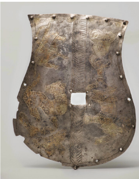
A Mardzsani-gyűjtemény három, Dél-Oroszországból származó, ismeretlen leelőhe-lyű tarsolylemeze