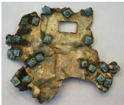
Az Andrejevskaja scsel-i tarsolylemez töredéke