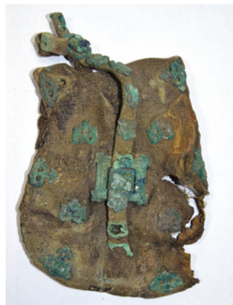
A martan-csui tarsoly háttáplapja