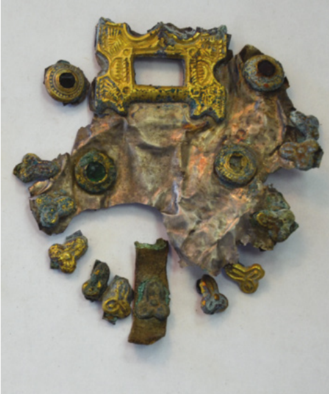
Az Andrejevskaja scsel-i tarsolylemez töredéke