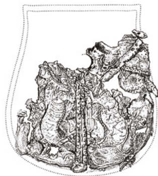
A ruszenyihai tarsolylemez rekonstrukciós rajza

A lemez alapanyaga ezüstalapú ötvözet, igen magas réztartalommal (46,7% ezüst, 38,2% réz, valamint 8,3% cink és 2,9% ólom). Megfigyelhető volt, hogy a lemez hátoldalára egy vékony, hártyszerű anyagréteget rögzítettek ragasztással. Ennek az anyagnak a leválasztására nem nyílt lehetőség, de a mikroszkópos felvételek alapján ragasztóval átitatott nemezmaradványként azonosítható. Az ily módon felragasztott nemezt minden valószínűség szerint a vékony ezüstlemez megerősítése érdekében alkalmazták. A fedlap egyrétegű, lenből vagy kenderből készült, vászonkötésű textilből állt. A feltehetően egykoron is színezetlen vászon széléit hozzávarrt bőrrel szeg-