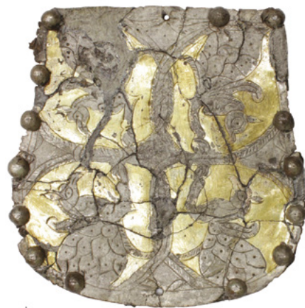
A Krasznogorszkij 8. (hamvasztásos) sír tarsolylemeze