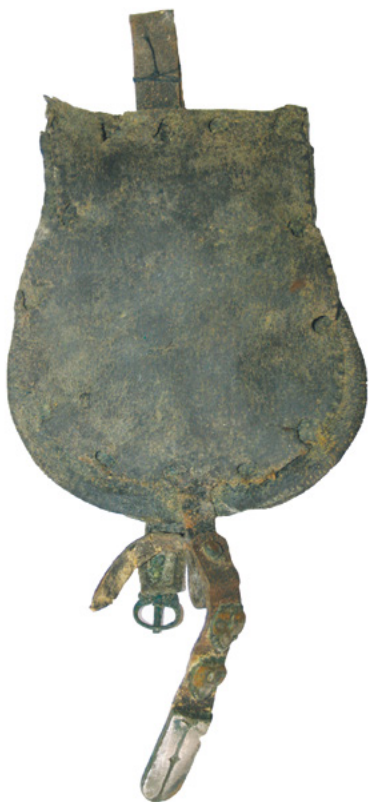
A panovói 2. sírban megmaradt bőr tarsolyszerkezet

ték. Ennekelsődleges szerepe az lehetett, hogy a laza szövésű textilt szilárdabbá tegye azon az íves vonalon, ahol a szegecsekkel a tarsoly fedlapjához rögzítették a tarsolylemezt. A vászon fedlap hátoldalán, azaz a tarsoly tároló funkciót betöltő teste felőli részén selyemmaradványok is megfigyelhetők voltak, melyek nagy eséllyel a tarsoly bélésének maradványai. A tarsolylemezes előlapot a zárószíj segítségével erősíthették a bőr tarsolytáskához.