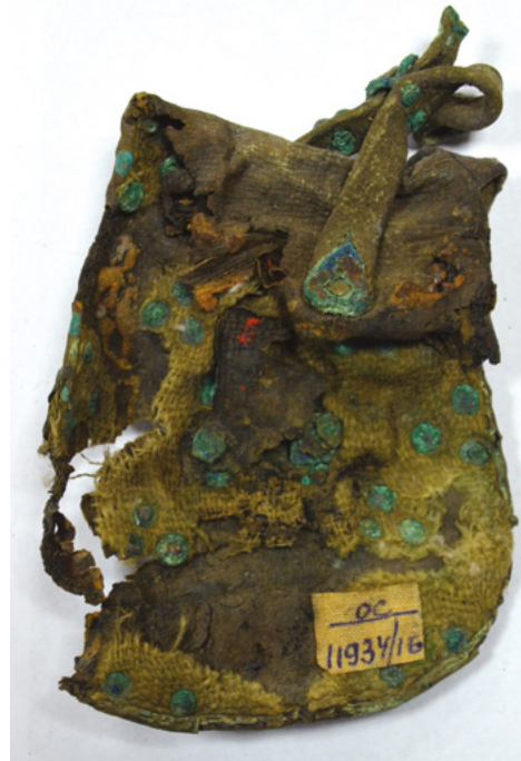
A Martan-csu 10. számú kaktombában feltárt peremveretes tarsoly

Összefoglalva elmondhatjuk, hogy a honfoglalás kori tarsolylemezek keleti analógiái közül a legtöbb a Volga–Káma vidéken került elő. A legfrissebb kutatási eredmények alapján időrendjüket tekintve többségük a Kárpát-medencei anyaggal egykorú, tehát nem értelmezhetőek a hazai anyag korai előzményeként, ráadásul helyi készítmények. Az említett terület a kora középkor során a Volgai Bolgár államhoz vagy annak befolyási övezetéhez tartozott. A hazai honfoglalás kori régészeti anyagban bőven megtalálhatók azok a volgai bolgár pénzveretek, dirhemutánzatok, melyek nagy valószínűséggel kereskedelem útján kerültek ide a távoli Volga-vidékről. A Kárpát-medencéből feltehetően teljes öveket, tarsolyokat és egyéb díszes tárgyakat hozhattak és vihettek magukkal a kereskedők, melyeket aztán fejlett fémművességüknek köszönhetően a helyi mesterek is utánozhattak. A kronológia, a földrajzi elterjedés és a közvetítő csatorna, valamint a motiváció talán egy ilyen magyarázat esetén tűnik jelenleg a legteljesebbnek. Feltehetően ezzel párhuzamosan léteztek kaukázusi kapcsolatai is a honfoglalóknak a 10. században, amelyet egyre több analógiás tárgytypus, de még inkább speciális selyemleletek támasztanak alá.