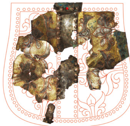
A bajanovói tarsolylemez töredékei és egykori díszíté- sének rajzos rekonstrukciója