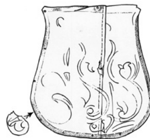
Bajanovo 279. sír (Oroszország, Permi határterület)