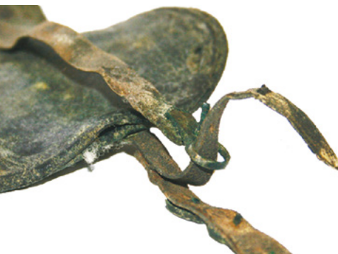
A panovói 2. sírban megmaradt bőr tarsolyszerkezet részlete (záródása)