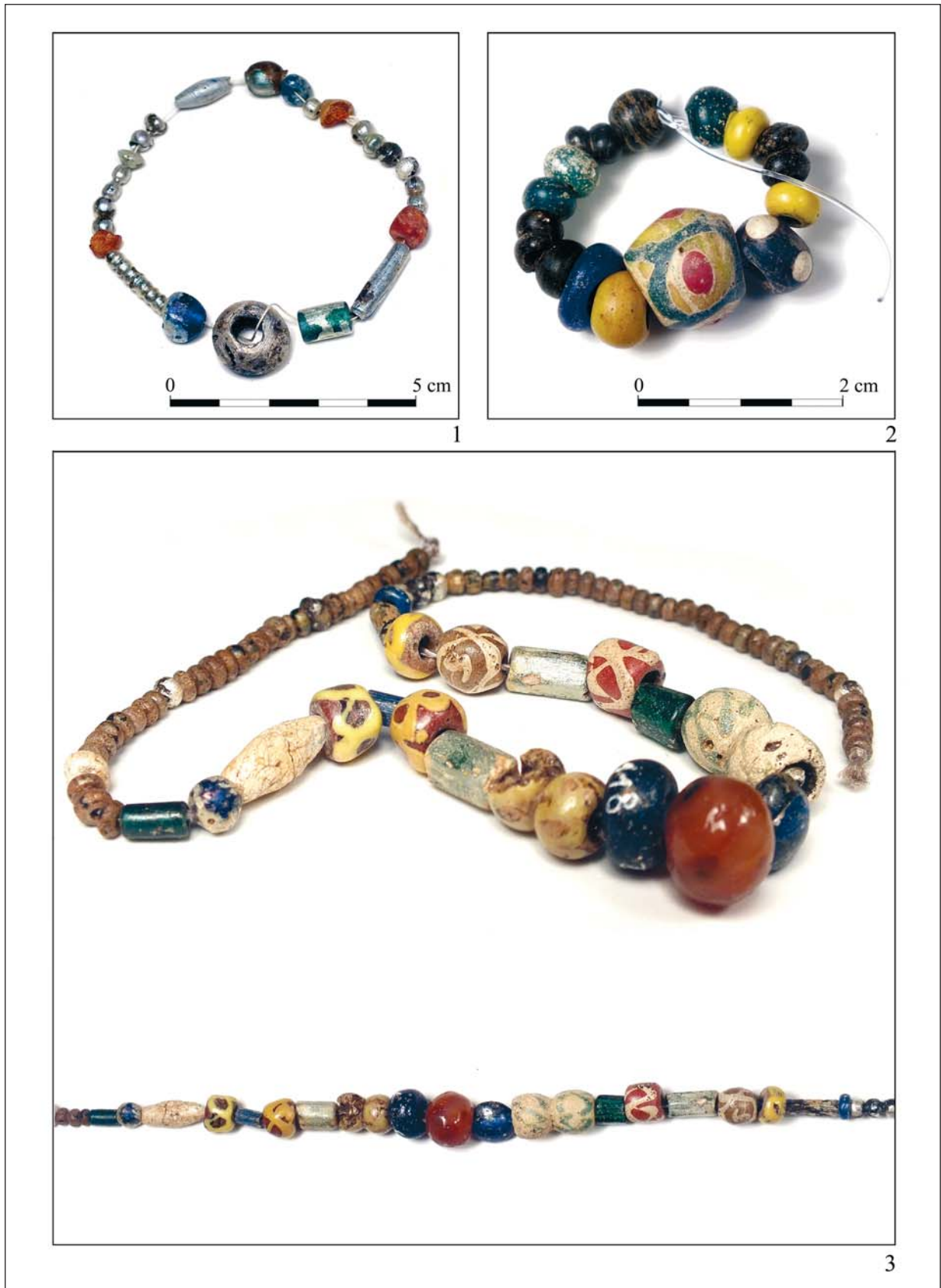
1. kép. Az 1971/46., 1963/11. és az 1963/18. sír gyöngysora Fig. 1. Bead necklaces from Graves 971/46, 1963/11 and 1963/18