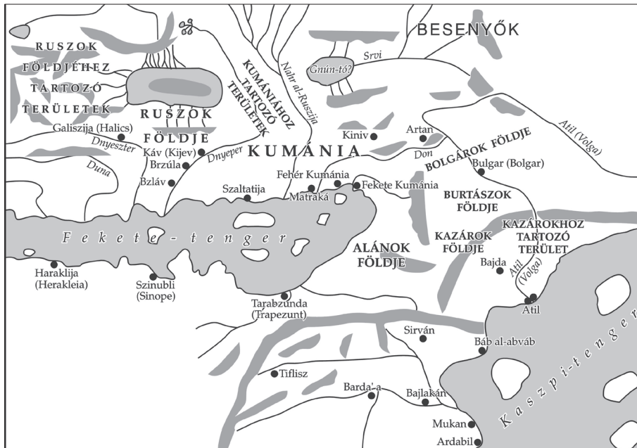
2. térkép A Fekete-tenger körüli területek al Idrísi alapján (1154 k.)

ruszok déli határa. A folyók leírásánál pedig a következő olvasható róla: „Egy másik folyó a Ruta, amely a besenyők, a madzsgarik és a ruszok közötti határon lévő hegyből ered. Ez a folyó azután az oroszok határán fut, a szaklábok vidékéig elér, s az e vidéken lévő Hurdáb városához ér el. Itt Hurdáb népe használja szántóin és legelőin.” 57 Mindebből az derül ki, hogy a besenyő–magyar–orosz hármashatár régiójában van egy hegység, a nevezett folyó forrásvidéke, amely azután nyugat felé folyik. Ilyen folyó azonban a valószínűségben nincs Kelet-Európában. Ha azonban a 12. században dolgozó Idrísi térképére tekintünk, akkor mégis láthatunk egy effélet: nála a Volga nem nyugatról, hanem keletről érkezik, a folyó felső szakaszának tehát a Kámát tekinti, a muszlim földrajzi felfogásnak megfelelően. A kazányi könyöknél azonban több hegyet is jelöl, s ezekből egy folyó is ered, amely nyugat felé folyik, hogy azután egy tóba ömölve tűnjön el. 58 (2. térkép)